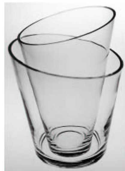
MR 2001 00918 "En vase" (Indehaver: Menu A/S)

Vær opmærksom på, at det er de rigtige og fuldstændige afbildninger, du indgiver til Patent- og Varemærkestyrelsen. Det er meget vigtigt, da du ikke senere kan indgive nye afbildninger, hvor produktet har ændret udseende. Du skal derfor være sikker på, at afbildninger eller model virkelig viser det design, du ønsker beskyttet.