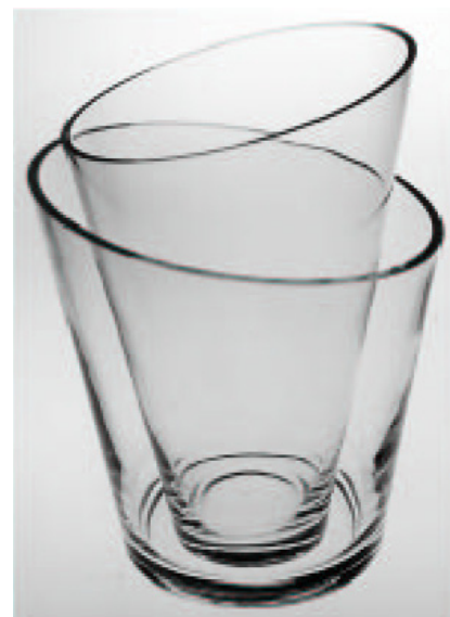
MR 2001 00918 "En vase" (Indehaver: Menu A/S)

Vær opmærksom på, at det er de rigtige og fuldstændige afbildninger, du indgiver til Patent- og Varemærkestyrelsen. Det er meget vigtigt, da du ikke senere kan indgive nye afbildninger, hvor produktet har ændret udseende. Du skal derfor være sikker på, at afbildninger eller model virkelig viser det design, du ønsker beskyttet.